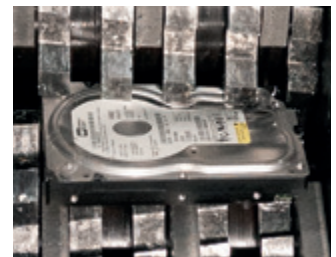
Los rodillos, de sólido corte de acero endurecidos por inducción son robustos y garantizan un alto nivel de durabilidad.

Incluso la destrucción descentralizada de grandes cantidades de diversos tipos de soportes de datos puede realizarse de forma fácil y cómoda, de forma segura, económica y cumpliendo los requisitos de la protección de datos.