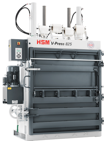
V-Press 825 Plus 490001730