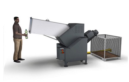
Perforation of full PET bottles, carton based packaging containers and cans