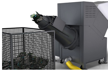
Specific discharge system for liquids via hose or pump