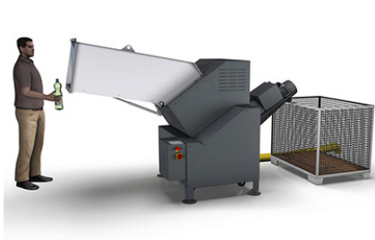
Very low space requirement thanks to compact and sturdy design