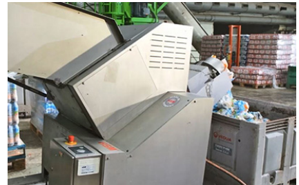
Cutting unit made of specially hardened steel, other machine frame parts made of stainless steel