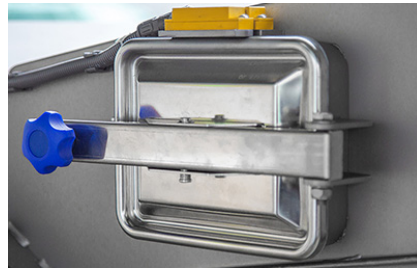
Easy to clean due to inspection door and hinged outlet chute