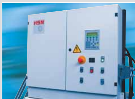
Armoire électrique pour composants de l'installation relatifs au démarrage de l'ensemble du système ; commande automatique par cellule photoélectrique