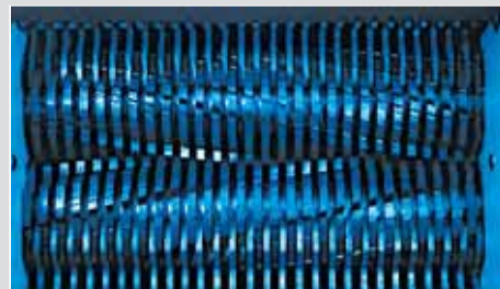
Etage 2 : Affineur HSM P 500.2 Taille des particules : 6 x 40 - 53 mm