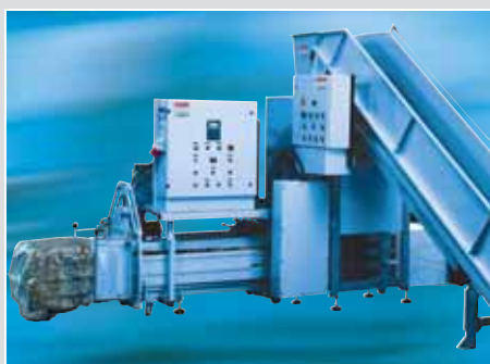
Système de recyclage HSM DuoShredder 5540.2 avec presse à balles HSM KP 98