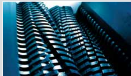
Etage 2 : Affineur HSM P 600 Taille des particules : 10,5 x 40 - 76 mm