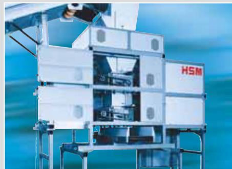
HSM TriShredder 6060 avec blocs de coupe 2 et 3 escamotables; insertion automatique d'une trémie à la place du bloc