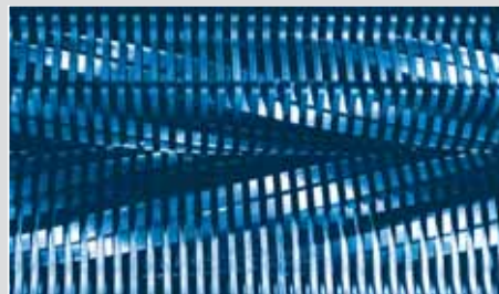
Etage 2 : Affineur HSM P 400.2 Taille des particules : 5,8 x 50 mm