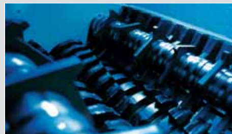
Etage 1 : Prébroyeur HSM V 570 Taille des particules : 20 x 155 mm