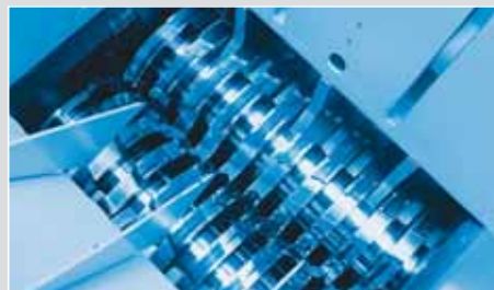
Etage 1 : Prébroyeur HSM V 550 Taille des particules : 20 x 155 mm