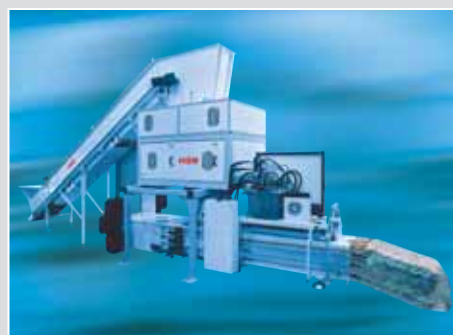
Système de recyclage HSM DuoShredder 5750 avec presse à balles HSM KP 100.1