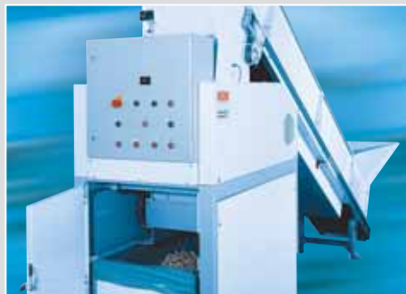
HSM DuoShredder 5540.2 solo avec accessoires : convoyeur d'alimentation et chariot de réception de matériau