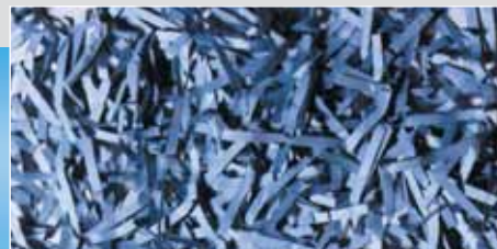
Etage 3 : Affineur HSM P 600 Taille des particules : 7,5 x 40 - 80 mm